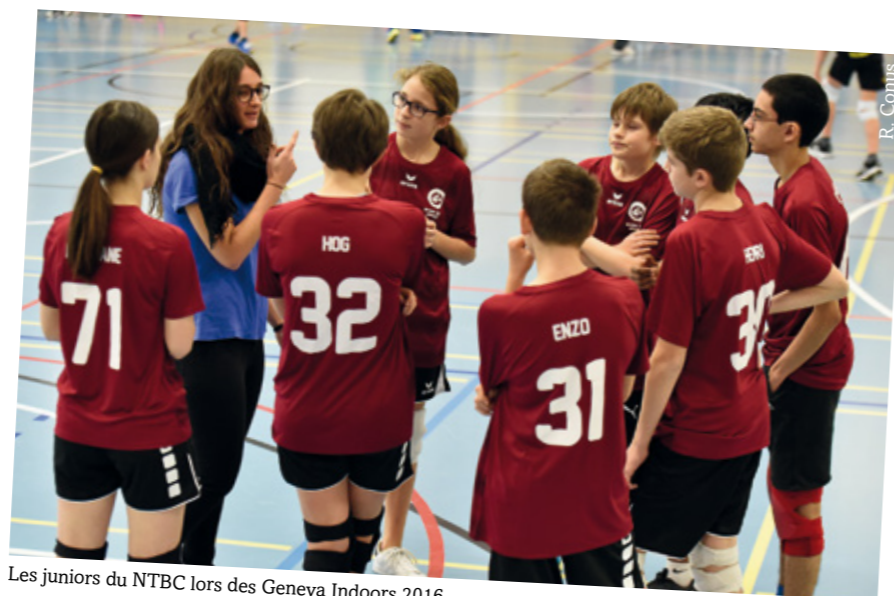
Les juniors du NTBC lors des Geneva Indoors 2016