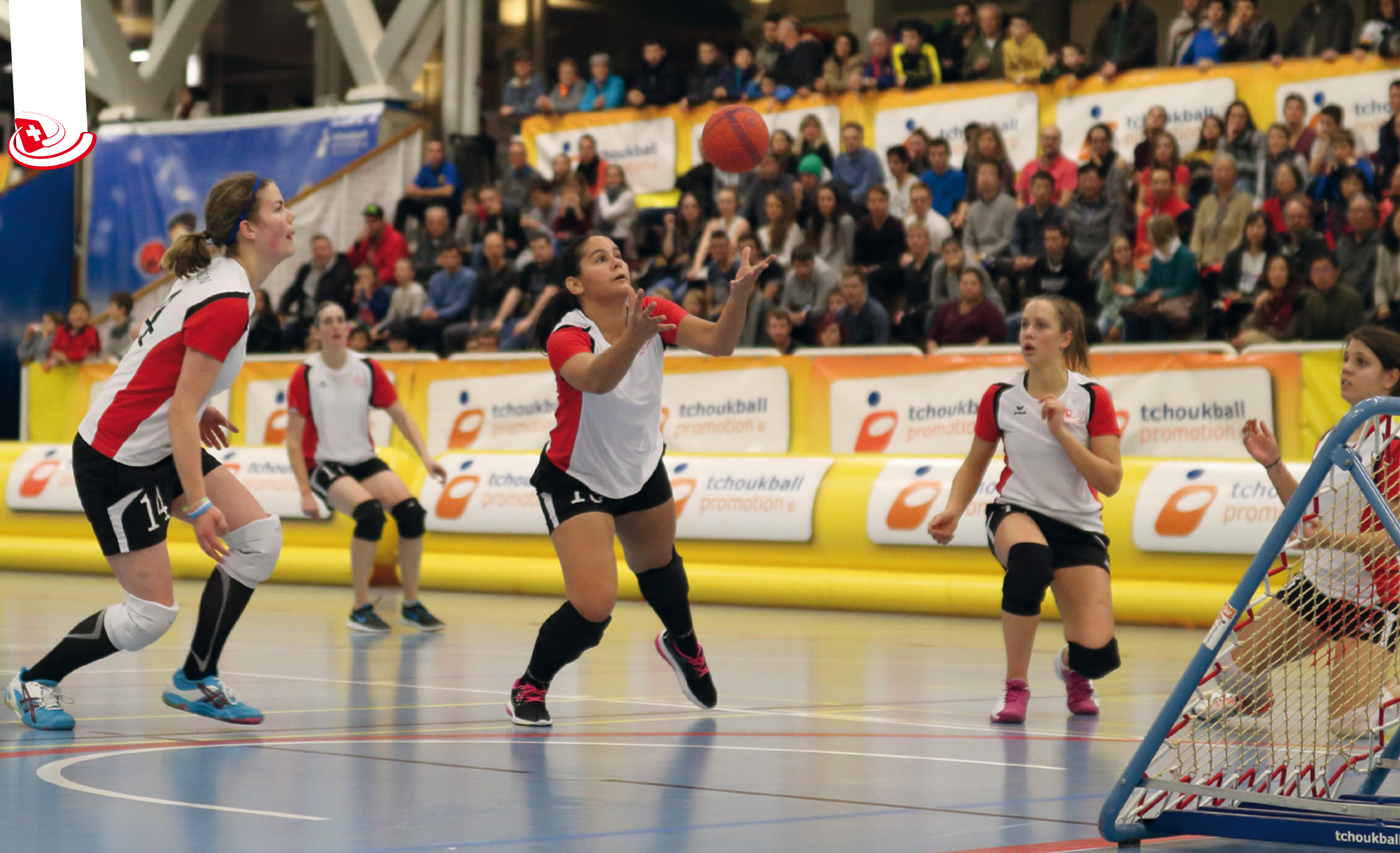
Tchoukball Geneva Indoors Nations Cup – Finale féminine Suisse – Taiwan 17 décembre 2016