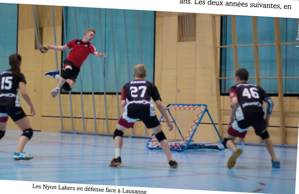
Les Nyon Lakers en défense face à Lausanne