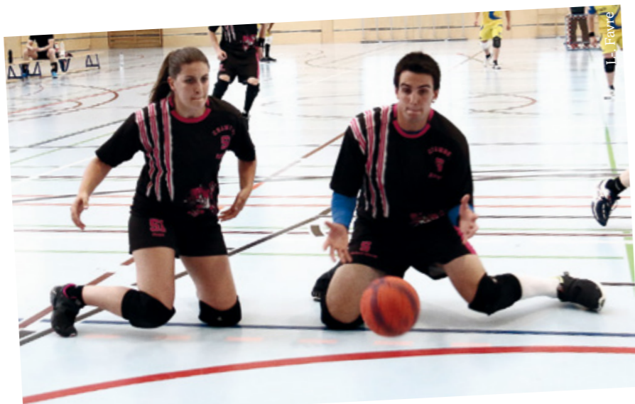
Jonas en défense avec les Meyrin Panthers lors de la Coupe suisse

Ta place préférée sur un terrain ? Centre-cadre.