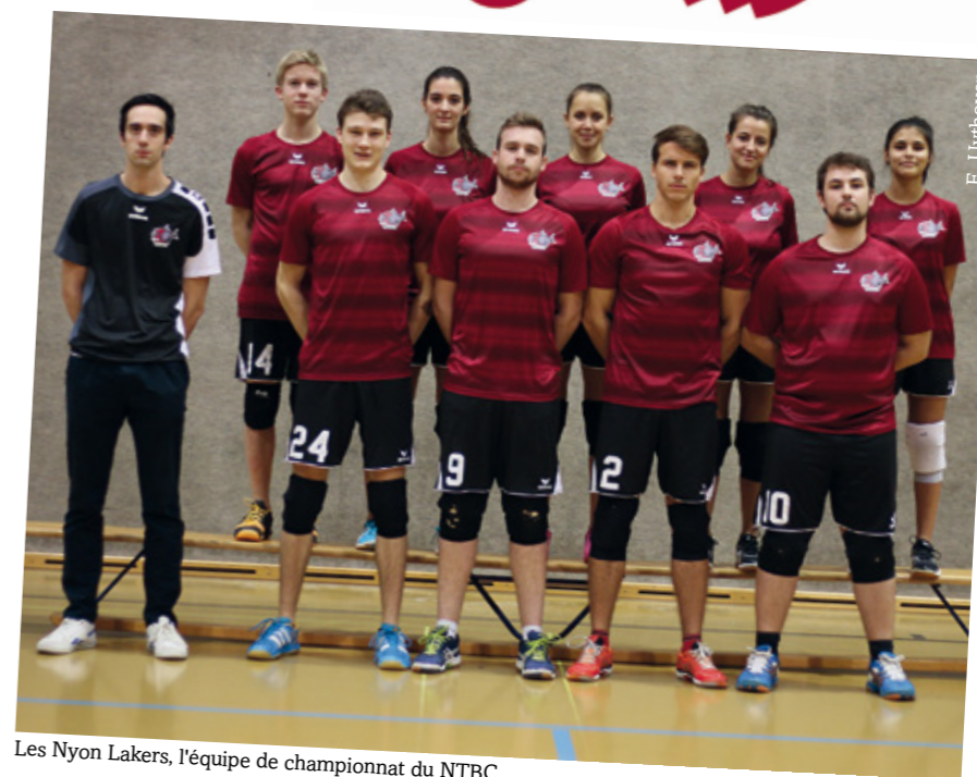
Les Nyon Lakers, l'équipe de championnat du NTBC

dans toute la région de la Côte. Mon rêve est d'accrocher un titre national dans le palmarès du club.