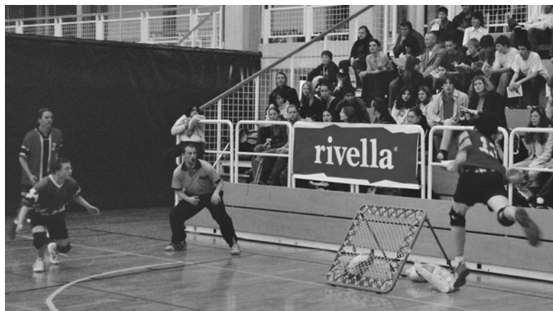
Match Genève - La Chaux-de-Fonds le 12 avril 2005 à Genève