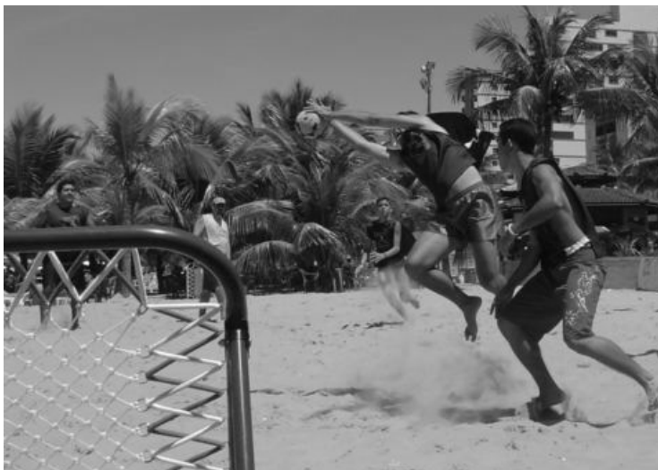
Défense en extension lors d'un match de beach tchoukball

Quelques années plus tard, le beach tchoukball s'étend au delà des frontières brésiliennes et commence à être joué