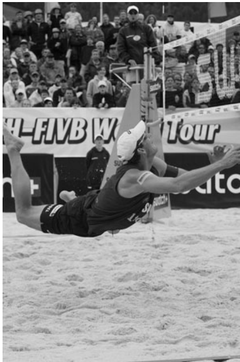
Beach volley: plongeon aérien

se modifier pour devenir un sport à part entière. En effet, dans les années 50 et 60, le « beach » devient un vrai « style de vie », « un look spécifique » : plage, soleil, lunette de soleil et musique branchée, associés à la pratique du surf. Même les Beatles seraient venus taper dans la balle à Sorrento Beach !