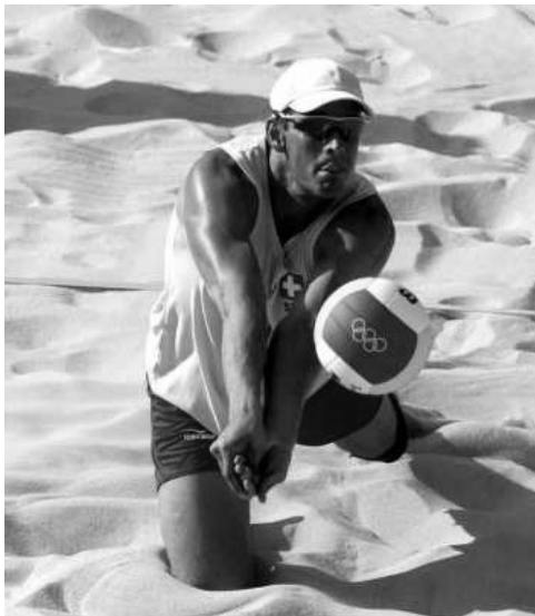
Beach volley: position de réception dans le sable.

Depuis ces balbutiements, la manière de jouer au volleyball à la plage n'a cessé de