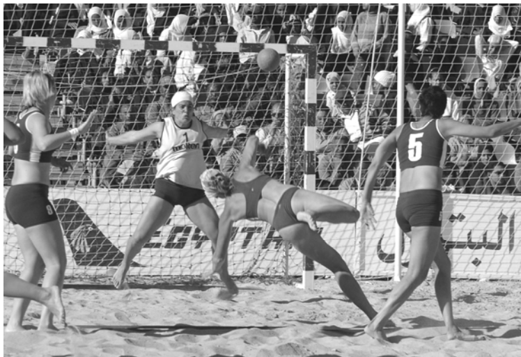
Tir en extension dans un match de beach handball féminin

nus...), jouer au football sur du sable introduit de nouvelles dimensions : le jeu à haut niveau devient nettement plus aérien et lorsqu'il est joué par les meilleurs joueurs mondiaux, il peut offrir aux spectateurs des parades spectaculaire.