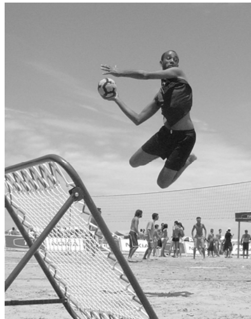
Attaquant durant un match de beach tchoukball sur les plages en Brésil

en Europe : sur les rives du lac Léman à Lausanne (tournoi de club) et sur les plages de Rimini (Italie, tournoi européen).