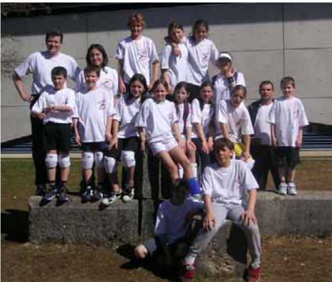
L'équipe des juniors de Morges avec leur président et leur entraîneur.