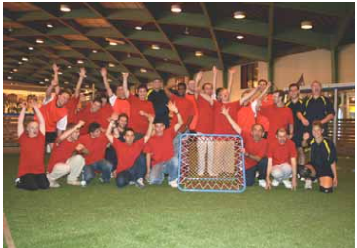
Les membres du Lausanne Tchoukball Club et de l'association Fair Play

Après quelques semaines, de nouvelles personnes ont rejoint cet entraînement et le "bouche à oreille" fait son effet. On espère bien sûr que d'autres associations de sport handicap se lancent dans le