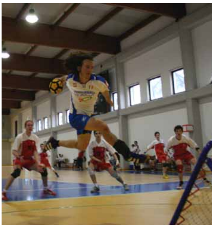
Un aperçu du match homme du samedi 17 mars à Saronno