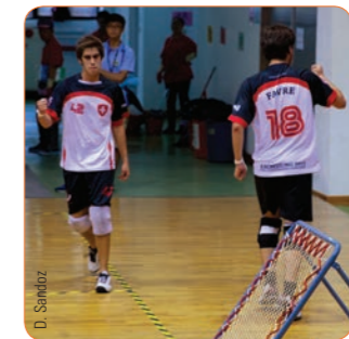
Maillots et shorts «sublimés» pour nos équipes suisses M18 au championnat du monde. Réalisé selon le design précis demandé par la fédération.