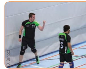
Maillots et shorts «Erima» avec flocage du logo du club, du numéro et du nom du joueur