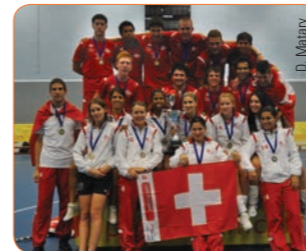
Trainings, maillots et shorts «Erima» avec flocage pour nos équipes suisses championnes d'Europe