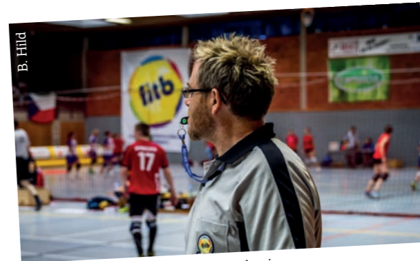
L'arbitre Leigh Merchant pendant les derniers championnats d'Europe à Radevormwald

Utilisez-vous Facebook, Twitter ou Instagram ? Avez-vous une information sur le tchoukball en Suisse à partager à travers vos mots ou des photos ? Postez-les avec le hashtag #tchouksuisse ! Une sélection des meilleures publications seront mises en avant dans le prochain numéro du tchouk up ! → C.P.