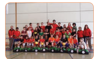
Sacs de sport avec flocage pour les participants au Camp junior M12 et M15