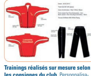
Trainings réalisés sur mesure selon les consignes du club. Personnalisation avec une grande broderie dans le dos et le logo du club brodé devant en «position coeur»