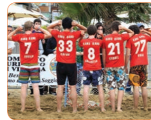
Offre spéciale «urgent et économique»: Dès 25.- pour le maillot et le flocage tout compris !!