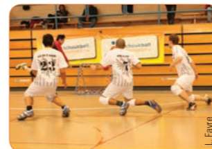
Maillots et shorts «sublimés» réalisés selon le design précis demandé par le club (livrés en coupe femme et coupe homme)