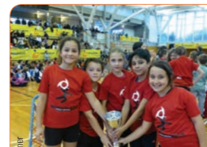
T-shirts avec impression sérigraphie du Geneva Indoors 2012