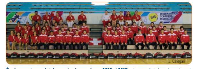
Équipement complet de nos équipes suisses M18 et M15 qui ont participé au championnat du monde à Taiwan: Maillots «sublimés», training «Erima», polo, sac de sport avec flocage