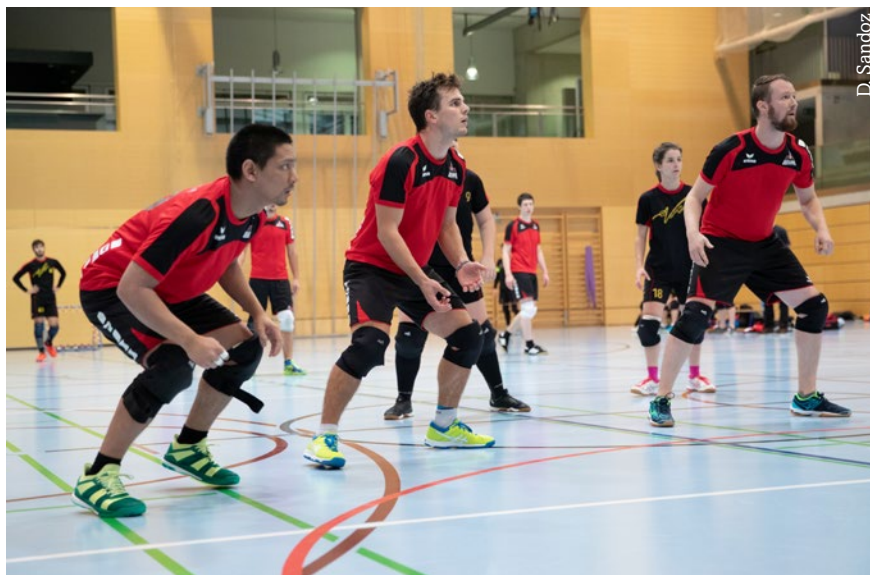
Lausanne Olympic en défense face aux Geneva Dragons lors d'un match de ligue A du championnat

Antwort : B) 2013-2014 spielten die Piranyon Origin als einziges Team aus dem Waadtland in der obersten Liga mit.