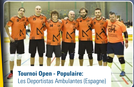
Tournoi Open - Populaire: Les Deportistas Ambulantes (Espagne)