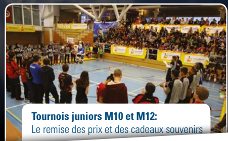
Tournois juniors M10 et M12: Le remise des prix et des cadeaux souvenirs