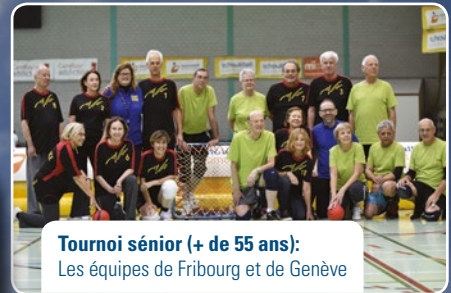
Tournoi sénior (+ de 55 ans): Les équipes de Fribourg et de Genève