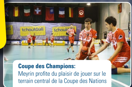
Coupe des Champions: Meyrin profite du plaisir de jouer sur le terrain central de la Coupe des Nations