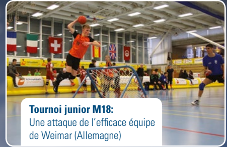
Tournoi junior M18: Une attaque de l'efficace équipe de Weimar (Allemagne)