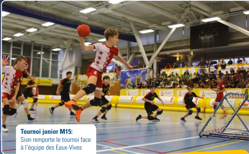
Tournoi junior M15: Sion remporte le tournoi face à l'équipe des Eaux-Vives

De belles émotions lors de l'édition de décembre 2018: