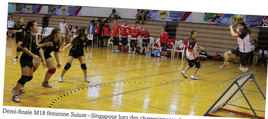
Demi-finale M18 féminine Suisse-Singapour lors des championnats du monde juniors à Taiwan

Parlons-en donc de l'avenir. L'été prochain se dérouleront les championnats d'Europe à Radevormwald, en Allemagne. Il n'y aura malheureusement pas de tournoi junior, mais nos deux équipes adultes, masculine et féminine, ont chacune un titre à défendre! Cette compétition permettra aussi de faire le point sur les améliorations à apporter afin d'être prêt pour les championnats du monde qui auront lieu en 2015. Rien n'est encore officiel pour ce qui est du lieu de ces mondiaux, mais il y a de fortes chances que ceux-là se passent au Brésil. Nos