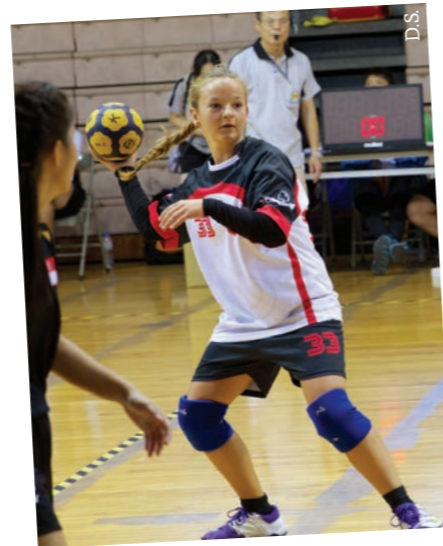
Frauen U18 Halbfinale Schweiz-Singapur

Nach diesen Qualifikationen fanden sich alle drei helvetischen Equipen in der Halbfinale gegen Singapur. Das ist bis dahin ein sehr schöner Wer-