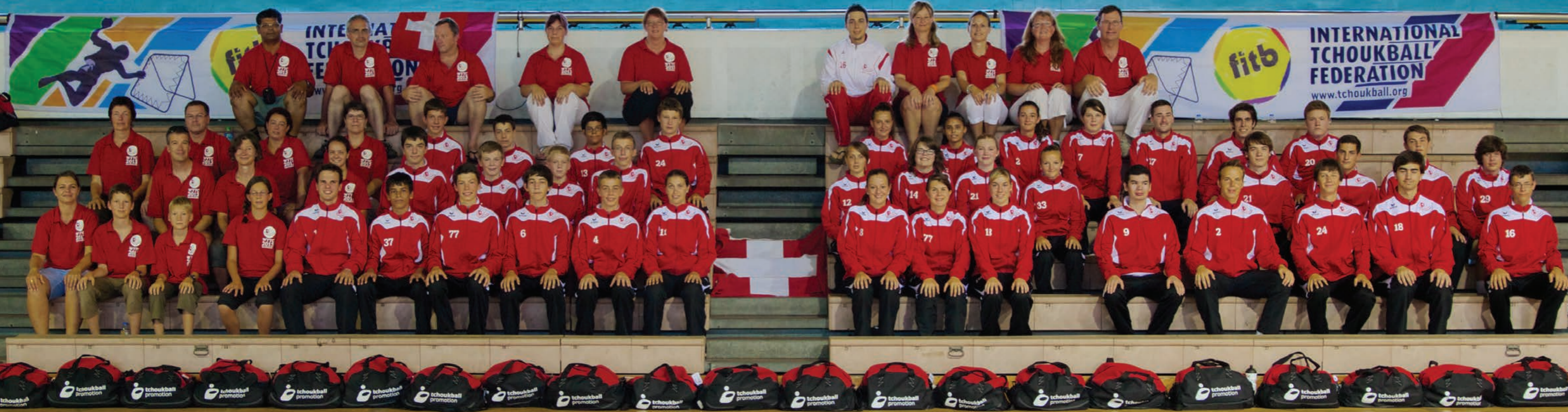
championnats du monde juniors de tchoukball Kaohsiung, Taiwan, 9 au 11 août 2013 délégation suisse