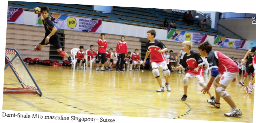
Demi-finale M15 masculine Singapour-Suisse

Après deux jours d'acclimatation, la compétition a bien démarré pour les équipes suisses. Sur les six matchs joués lors de la première journée, l'on compte cinq victoires. Les garçons M18 se sont facilement défaits de Hong Kong (55-20) et de la Corée (48-24) et les filles M18 n'ont pas eu de problème avec l'Inde (38-20) ou Hong Kong (15-50). Ce fut un peu plus difficile pour les M15 qui après un match tendu, ont réussi à décrocher une belle victoire face à Macao (39-41). Mais ils se sont ensuite fait corriger par Taiwan B (26-48). Toutefois pas d'inquiétude, cette deuxième équipe locale a été retirée du classement après les matchs de qualification.