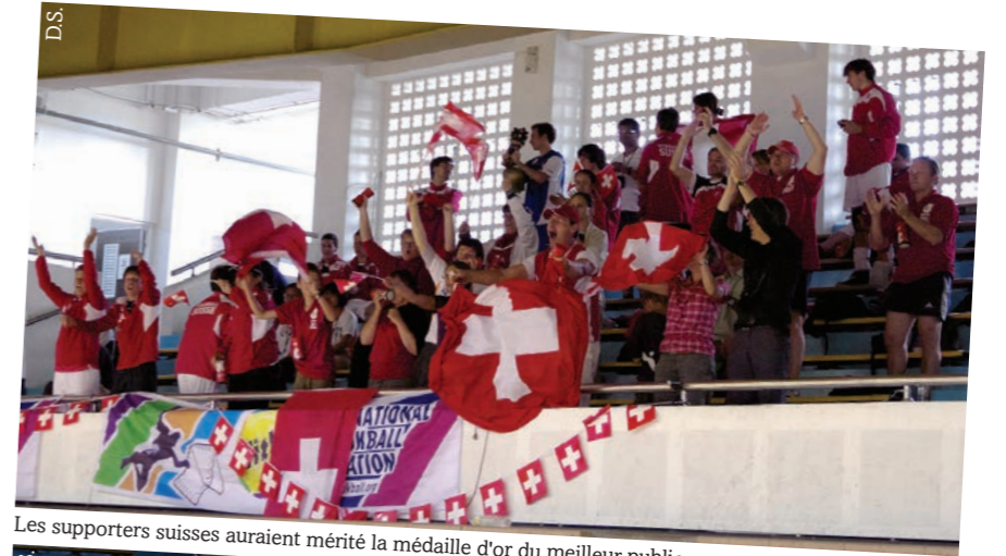
Les supporters suisses auraient mérité la médaille d'or du meilleur public.