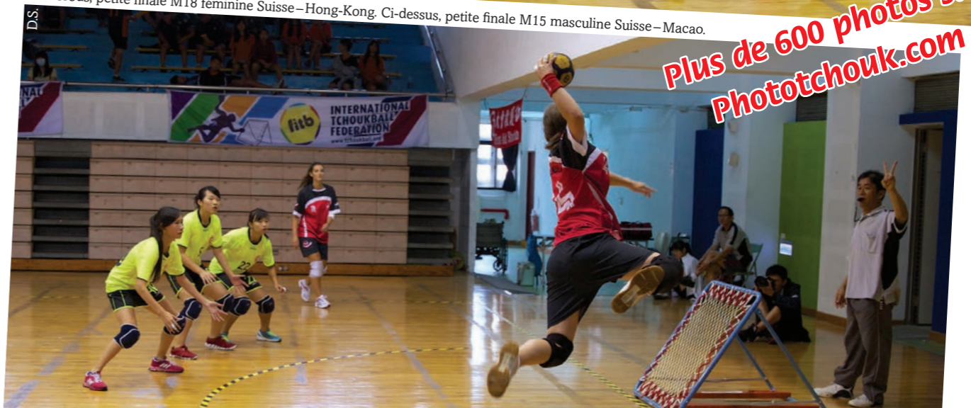
Ci-dessous, petite finale M18 féminine Suisse-Hong-Kong. Ci-dessus, petite finale M15 masculine Suisse-Macao.